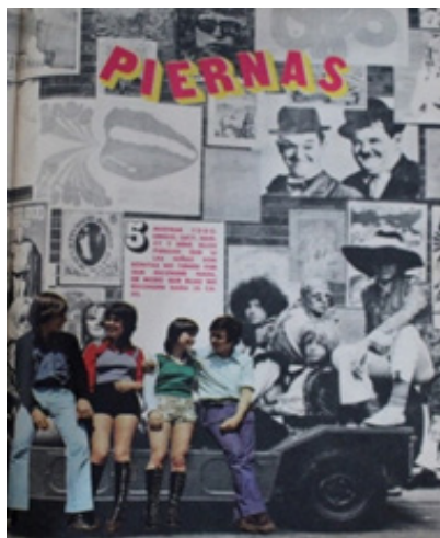
Imagen 5 70 . Fotografías de Onda N°4, 29 de octubre 1971.