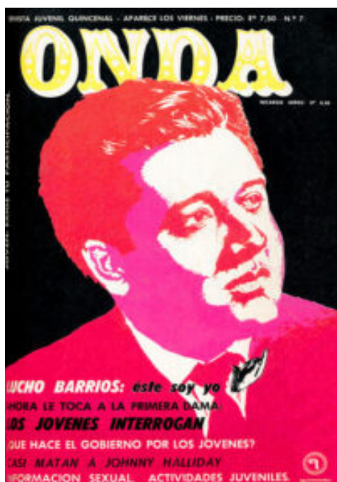
Imagen 3. Portada Onda N°7 10 de diciembre de 1971 46 .