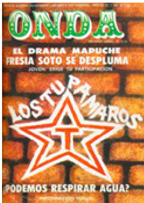
Imagen 7. Portada Onda N°10, 21 de enero de 1972.