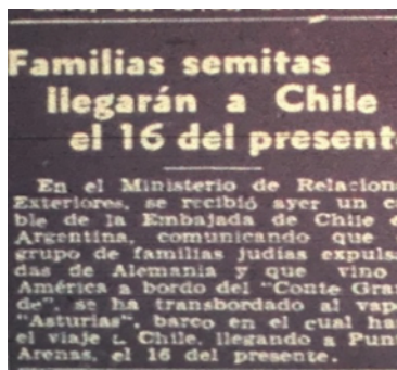
Imagen N°1. Diario La Hora 13 de marzo 1939