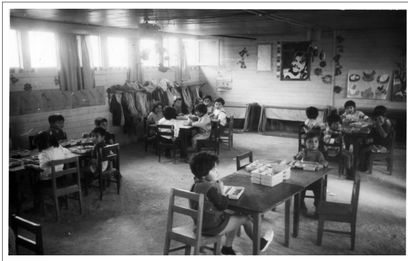
Foto 3. Jardín Infantil, Campamento Nueva La Habana

La primera medida fundamental que tomaron para evitar divisiones internas en el campamento fue mezclar a