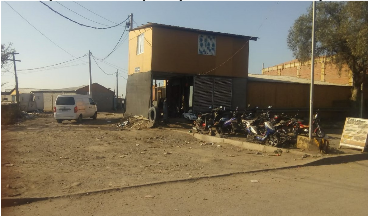
Entrada sur poniente de la toma “Un nuevo amanecer”. Foto tomada por Tomás Bustamante Arias el 17 de julio de 2021.

Por el poniente se puede entrar ya sea por el parque Errazuriz o desde el vivero de dicho lugar, tanto desde allí, como de cualquier entrada se pueden visualizar una amplia diversidad de autoconstrucciones, desde pequeñas piezas de madera (en menor medida), a construcciones de dos pisos con radier, variados colores, protecciones y plantas decorativas, diversas formas y dimensiones del espacio, varios utilizados tanto como para ser hogares así como pequeños negocios, restaurantes, peluquerías, ferreterías y/o algún servicio que puedan ofrecer.