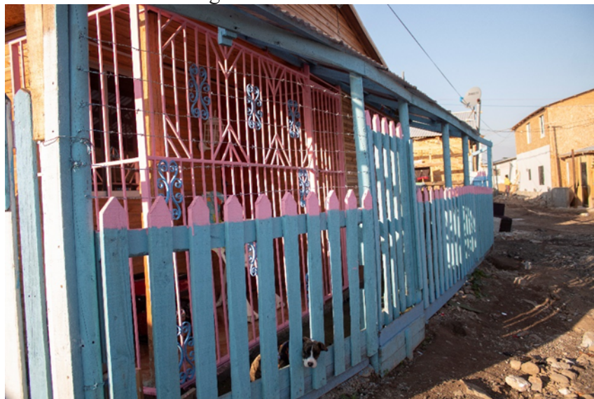
Imagen 3: Calle interna