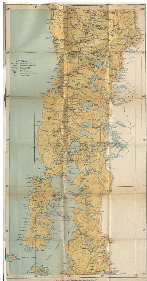
Figura 8. Mapa turístico, Guía del Veraneante (1938)