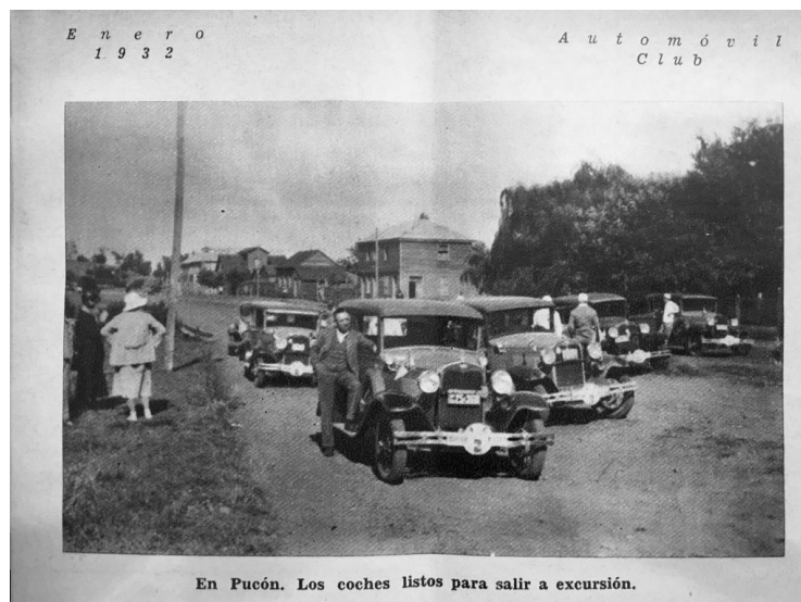
Figura 4. Revista Automóvil Club (1932)

Fuente: Revista Automóvil Club, N°1. Ene-Feb, 1932. Biblioteca Nacional.