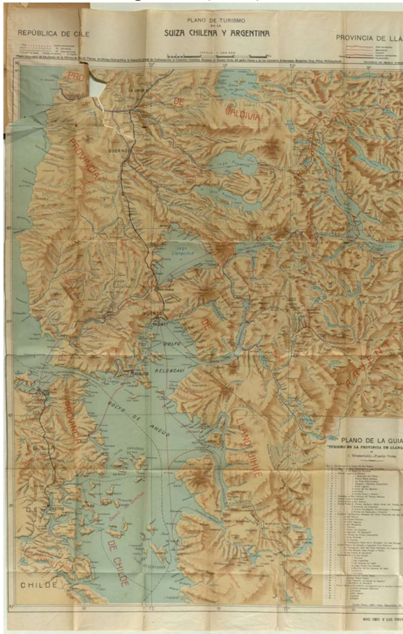
Figura 7. Mapa turístico Suiza chilena y Argentina (1921)