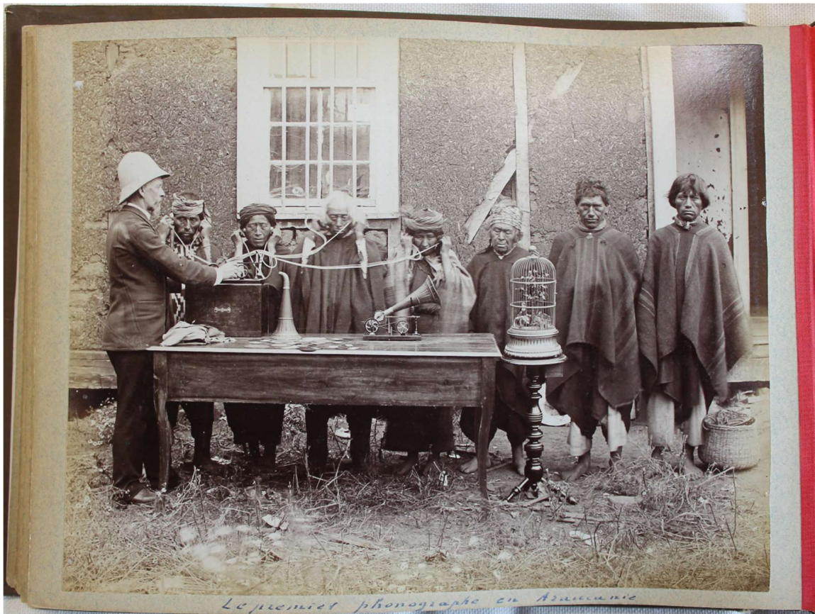
Figura 1. Una de las postales sobre la Araucanía producida por fotógrafos profesionales, adquirida por G. Verniory y enviada a sus familiares en Bélgica