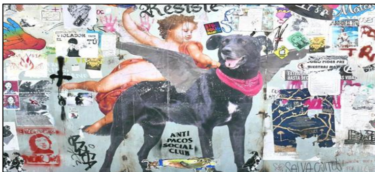
Imagen del Negro Matapacos en las paredes del centro cultural Gabriela Mistral