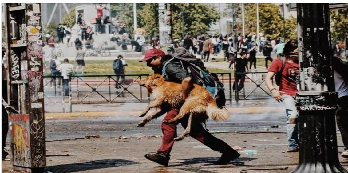
Perro herido en una manifestación

Nota. Obtenida en enero de 2023 en Milenio (2019).