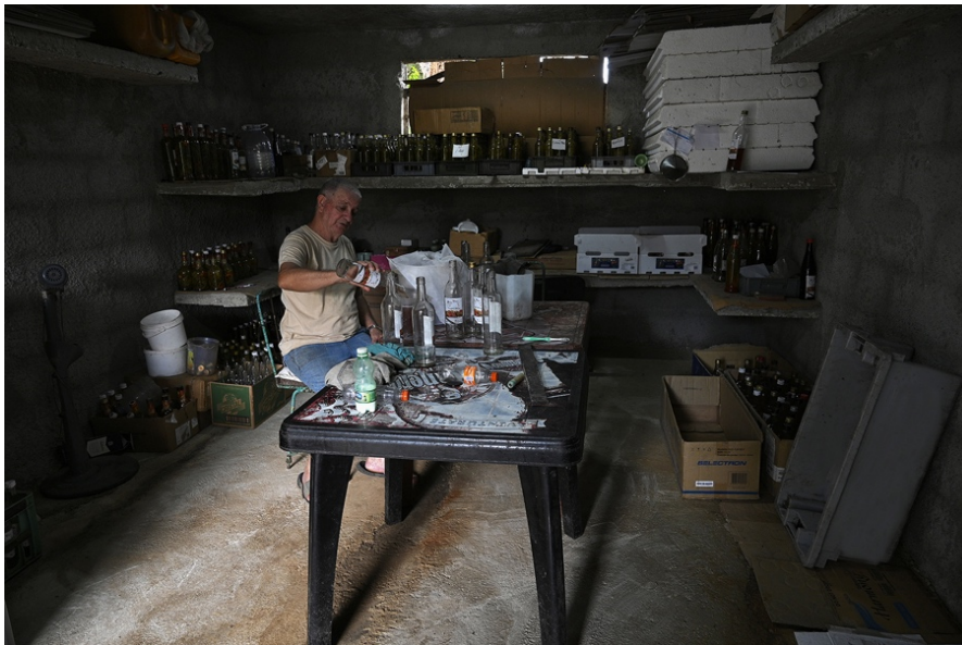
La base real de este trabajo es el amor que tengo por la naturaleza.

la tierra y la transformación de lo que ella produce –como una suerte de alquimista– es lo que le da sentido y pasión a su vida.