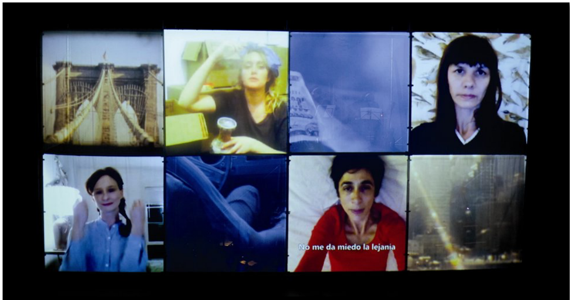
Fig. 6. Distancia (2013), de Matías Umpiérrez, Buenos Aires.