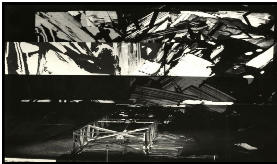
Fig. 4. Intolleranza (1965), ópera moderna de Luigi Nono. Escenografía de Josef Svoboda.

El teatro multimedia abarca una gran gama de posibilidades relacionales entre teatro y tecnología, sin embargo, posee algunas características más o menos estables, que permiten identificarlo: “el uso de procedimientos multimediáticos, las estructuras fragmentadas, la disminución de la importancia del actor, la desaparición del texto verbal, el énfasis en la imagen visual y los comentarios en off” (Villegas 6). Si bien estas características podrían estar presentes en teatros que no se denominen multimediales, pero que utilicen algunos componentes de multimedia, lo que lo hace identificable es la medida en que se utilice la multimedia y el lugar que se le dé en la estructura espectacular. Para Fernando de Toro, el teatro multimedia es “un nuevo teatro que incorpora los elementos multimediales como el actor principal del juego teatral” (154). De Toro distingue claramente entre los teatros que utilizan la tecnología multimedia cumpliendo una función “documental”, es decir, apoyando los hechos escénicos con proyecciones, voces en off, etc., pero siempre supeditados a un texto dramático y a la narración; y los teatros multimediales que hacen de la tecnología un personaje más, un componente que posee un rol autónomo y constitutivo del texto espectacular.