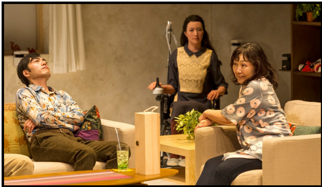
Fig. 3. La robot actriz Geminoid F junto a la compañía de teatro japonesa Seinendan, interpretando la obra Las tres hermanas de Chejov. Festival Fringe, Madrid, 2013.

¿Dónde queda ubicada esta nueva práctica entonces, donde la relación entre el actor y el espectador pasa por un elemento tecnológico-humanoide que imita las reacciones y gestualidades humanas? La actroide revive, de una manera muy particular, la necesidad imperiosa de mimesis, pues no se trata de verla actuar como un robot, sino de lograr identificar en ella los trazos de humanidad que la hacen sorprendente. Ella es reproductibilidad técnica, auto-reproduciéndose en cada presentación como discurso sin variación. Son los actores de carne y hueso los que se adaptan, en cierta medida a ella, sin embargo, al no variar jamás, se vuelve predecible y por ello, muy confiable para sus compañeros, como expresa Matsuda.