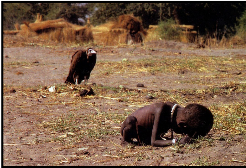
Fig. 1. Polémica fotografía de Kevin Carter ganadora del Pulitzer en el año 1994.

Son muchos los ejemplos de estos excesos en que es lamentablemente evidente esa intromisión del poder en el cuerpo de la que habla Foucault. Sin embargo, frente a lo que nos ocupa en este punto del artículo, la relación de este cuerpo con las nuevas tecnologías en la experiencia de nuevas formas expresivas, podemos fijar la atención en la construcción de un nuevo concepto de cuerpo sobre la escena.