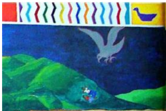
Imagen 7. Detalle, asesinatos en la huida hacia las montañas.

Resulta interesante destacar el uso de las columnas que por decisión colectiva fueron incluidas en el mural. Es así como, por ejemplo, sus lados fueron destinados a relatar detalles como la dura vida en las montañas de los sobrevivientes y también el entierro de los/as muertos/as frente a la Iglesia de Panzós (Imagen 8). El paso al tercer momento resulta muy significativo. Hacia la izquierda de los camiones militares, se abre hasta las montañas un arcoíris que emerge de un altar maya, donde hay velas prendidas junto al copal sagrado, el incienso de los dioses. A su lado, aparece la figura humana de mayores dimensiones del mural. Se trata de Adelina Caal, conocida como “Mamá Maquín”, líder del movimiento y la marcha, quien fuera la primera asesinada de la masacre según los testimonios de los sobrevivientes. Mirándonos fijamente, está vestida con el traje típico de Alta Verapaz, con su brazo izquierdo sostiene una canasta con cuatro elotes, cada uno de diferente color: