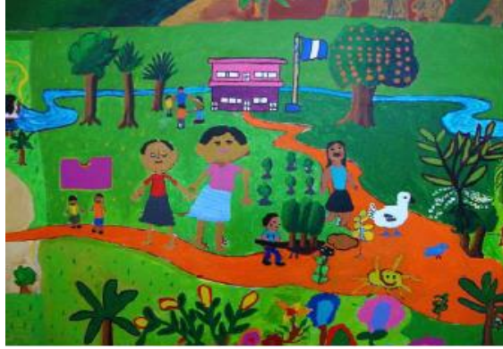
Imagen 10. La naturaleza. La Escuela. Niñas y niños jugando. Representaciones de mujer indígena y mujer ladina tomadas de la mano.