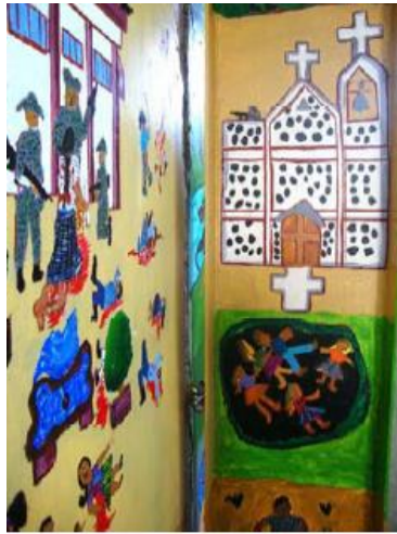
Imagen 8. Detalle del uso de las columnas.

tomadas de la mano, una indígena, la otra ladina (Imagen 10). De acuerdo con Matilde Caal, quien las pintó, esto simboliza la unión que debe haber entre la gente indígena y la no indígena para demandar juntos justicia y responsabilidad para impedir que suceda otra masacre como la de Panzós (Flores Escolero et al. 40). Hacia el final, una mujer y una niña de espaldas miran hacia el horizonte, hacia el atardecer. La niña sostiene al sol como si este fuera un barrilete en movimiento (Imagen 11). Las artistas sugieren “la niña mira confiada hacia un paisaje brillante y pacífico. La niña puede ver el futuro. El futuro, pareciera, está ahora en sus manos.” (42). Finalmente, no queremos dejar de mencionar que todo el límite del mural fue bordeado con una guarda como elemento decorativo, realizada con motivos típicos de las vestimentas de las mujeres guatemaltecas como los huipiles (blusa) y en los cortes (falda) (Imagen 12).