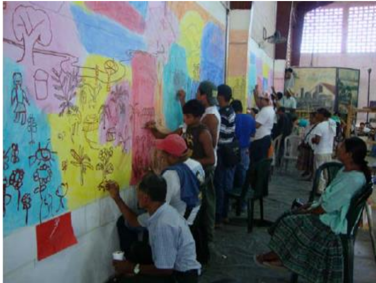
Imagen 2. Participantes dibujando sobre la pared que previamente fue segmentada a través de colores como una estrategia para orientar visualmente mejor a los/as hacedores/as. Los colores por segmentos le quitan fuerza a la inmensidad que aparenta la totalidad de la pared en color blanco.

Según las artistas, el paso del dibujo a la pintura fue rápido y sin inseguridades. Solo les sugirieron que tuvieran en cuenta la ubicación de la línea del horizonte que divide el plano del cielo con el de la tierra y les recomendaron recordar que, en un mural, aquello que está más lejos, se pinta siempre primero. Así fue como comenzaron a pintar el paisaje y luego las personas, los detalles y elementos narrativos que se verían de cerca.