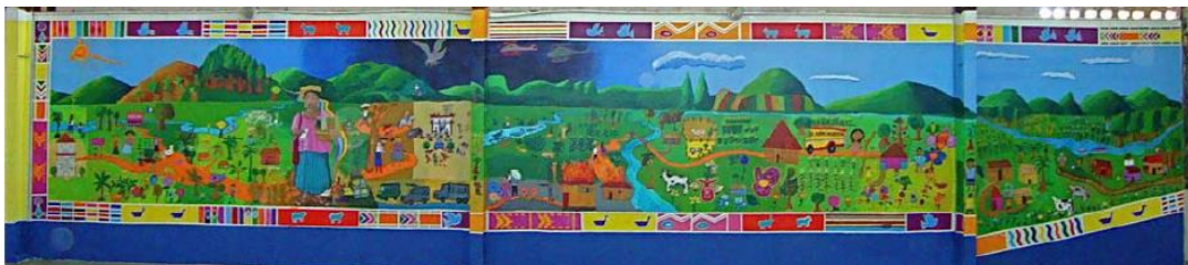
Imagen 12. Panorámica del mural. Guarda que bordea el límite del relato visual.