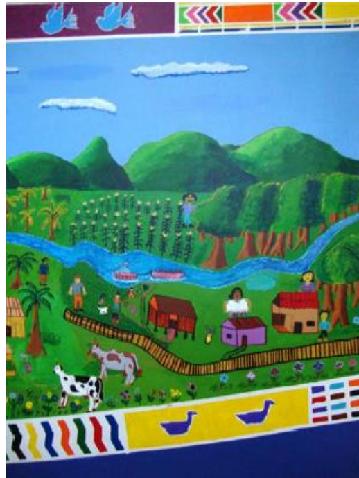
Imagen 5. La vida antes de la masacre.