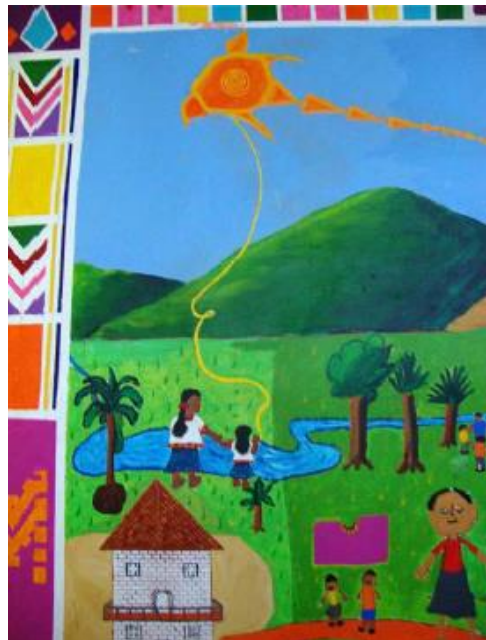
Imagen 11. Mujer y niña, que remonta al sol como un barrilete, tomadas de la mano miran hacia el horizonte, metáfora del futuro esperanzador de la comunidad.