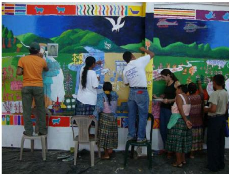
Imagen 4. Del dibujo a la pintura.

Imagen 3. Una vista más panorámica que da cuenta no solo de la magnitud del soporte y el mural, sino de todas las personas que trabajaron simultáneamente.