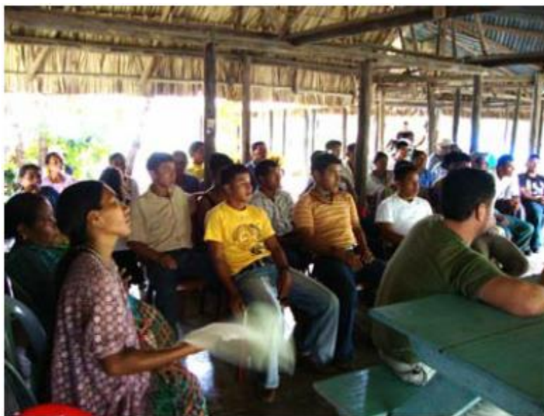
Imagen 1. Participantes del proyecto durante los primeros encuentros.. 6..