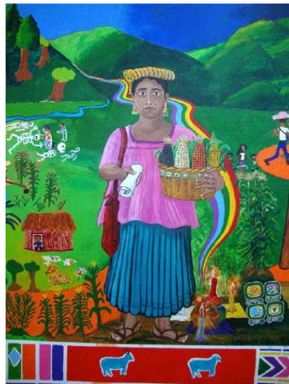
Imagen 9. Representación de “Mamá Maquín”.