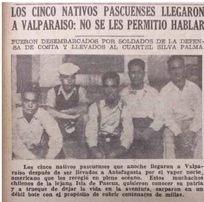
Imagen 3: Los cinco rapanui socorridos en alta mar a su llegada a Valparaíso. El Mercurio de Valparaíso , 4 de marzo de 1944.

¿Cuál es la importancia histórica de esta fuga? Ella mostró al resto de los isleños que era posible dejar Rapa Nui en un bote pequeño.