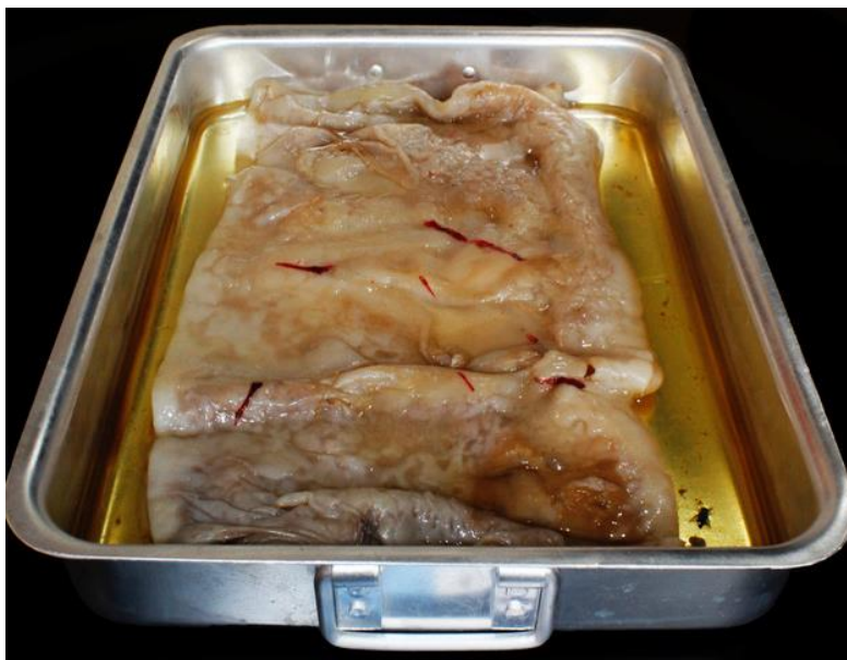
Fig. 3. Arte y ciencia en el laboratorio. Imagen de elaboración de Gabriela Punín, Laboratorio de la Universidad Técnica Particular de Loja, 2016.

Uno de los prejuicios que ha mantenido distanciados a la ciencia y el arte es la idea de que la primera es un proceder sujeto a métodos, mientras que el segundo es un quehacer libre que no admite condicionamientos metodológicos. Si en el campo de la ciencia no hay métodos, si en materia de métodos “todo vale”, el proceder del científico es un proceder libre, semejante al del artista. Paralelamente, si el arte es una forma de conocimiento, no es de extrañar que actualmente los artistas y los teóricos del arte estén ocupados en establecer el significado y el sentido de la investigación artística. Feyerabend, considerado el epistemólogo más definidamente posmoderno , propone repensar la ciencia y verla como arte . Esto debe ser entendido únicamente en el sentido de ver en la ciencia una situación análoga a la del arte.