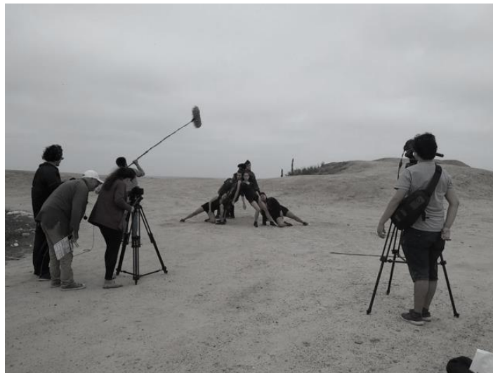
Fig. 6: Realización de la adaptación cinematográfica de la obra coreográfica sigue Corriendo de Talía Falconi. Estreno 2021. Ecuador.